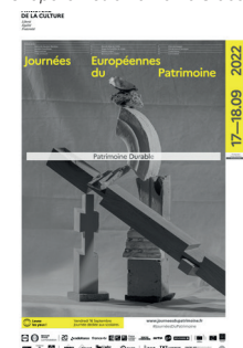
Affiche Journées du Patrimoine 2022