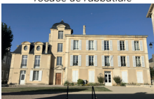
Hôtel de Pied-Foulard