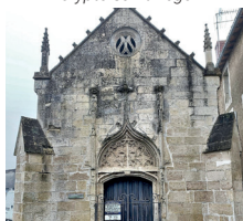
Chapelle Notre-Dame De Grâce