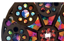
rosace de l'abbatiale