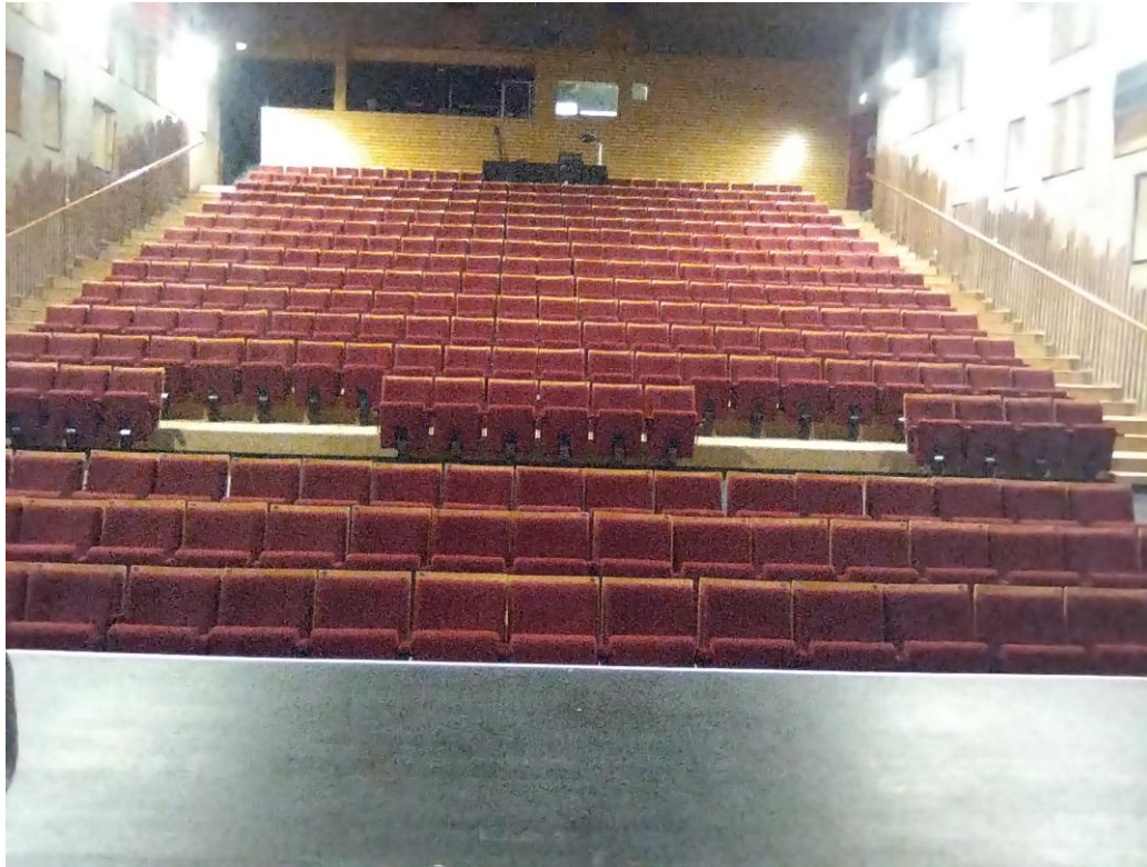
Vue depuis le fond de scène